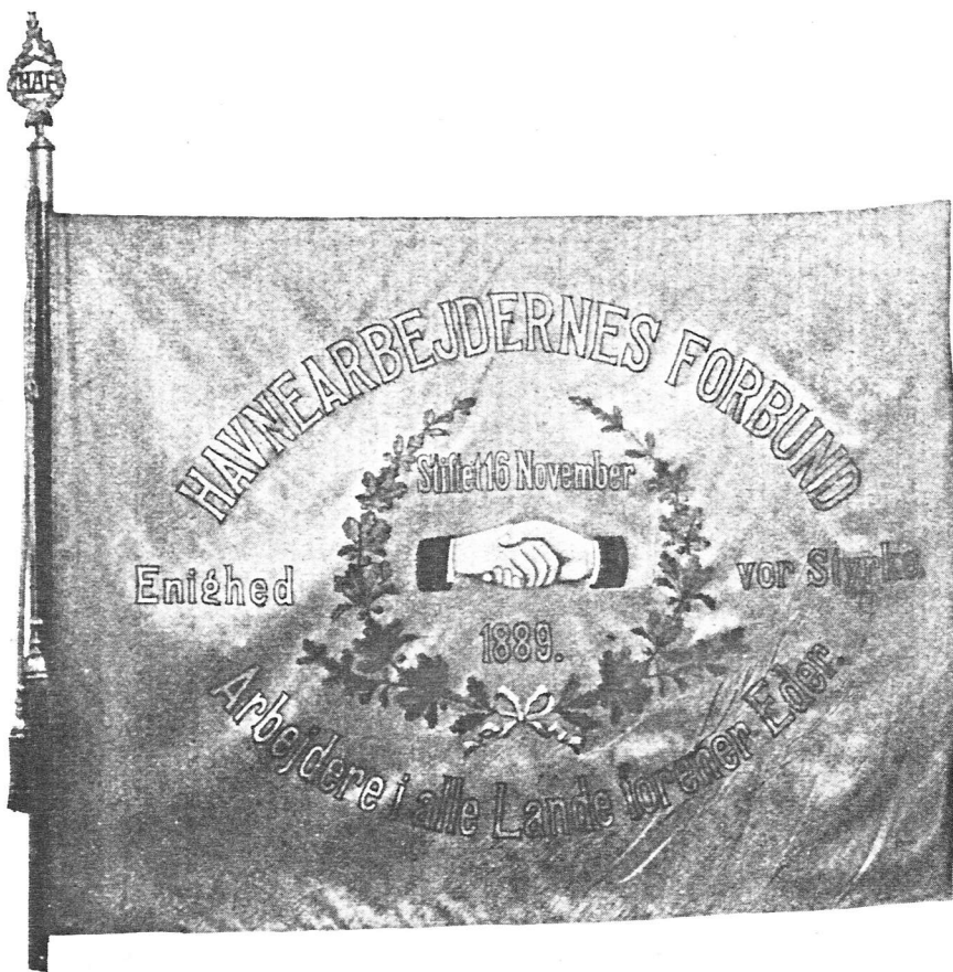
Stiftelsesdatoen paa Fanen skal formentlig angive den Dag, da Sæd- og Stykgodsarbejdernes Fagforening skiftede Navn til Havnearbejdernes Forbund. Dette skete imidlertid paa en Generalforsamling den 16. Okt. 1889. Ser man bort fra Navneforandringen, er Organisationens rigtige Stiftelsesdag den 1. August 1884.

andre end Foreningens Medlemmer, hvorved man dog undtog Kvæsthusbroen og Toldboden, hvor der fandtes mange uorganiserede Arbejdere.