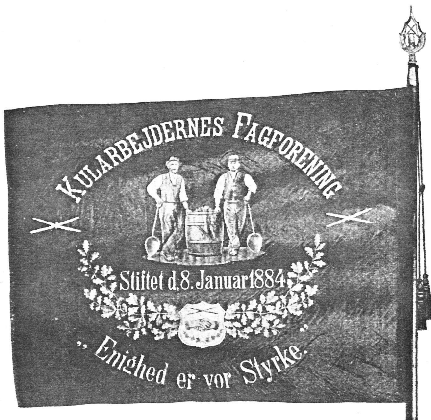
Kularbejdernes første Fane, der nu er skænket til Ophængning paa Bymusæet.